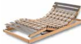
WERKMEISTER U 340 QUATTRO M2 Motorrahmen, 2-motorig