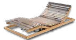
WERKMEISTER U 320 DUO M4 Motorrahmen, 4-motorig