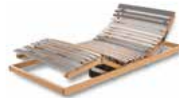
WERKMEISTER U 320 DUO M2 Motorrahmen, 2-motorig