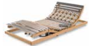
WERKMEISTER U 330 DUO PLUS M4 Motorrahmen, 4-motorig