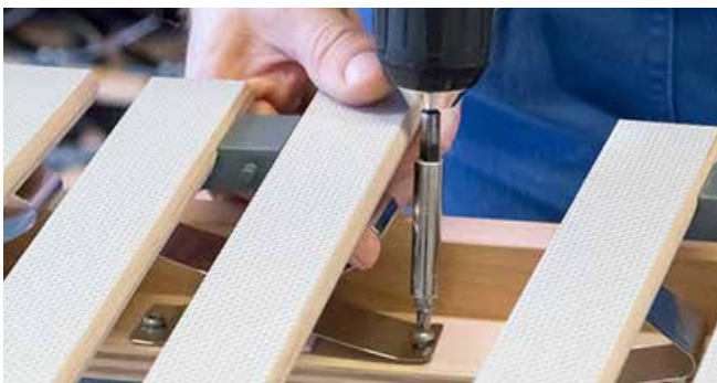
Sorgfältige Handarbeit in unserer Manufaktur.

Lassen Sie sich im Bettenfachhandel beraten, welche WERKMEISTER Unterfederung für Sie am besten passt. Händler in Ihrer Nähe finden Sie über die Händlersuche auf www.werkmeister-schlafkultur.de