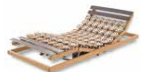
WERKMEISTER U 340 QUATTRO M4 Motorrahmen, 4-motorig