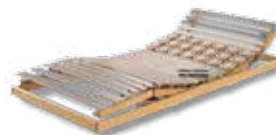
WERKMEISTER U 330 DUO PLUS M2 Motorrahmen, 2-motorig